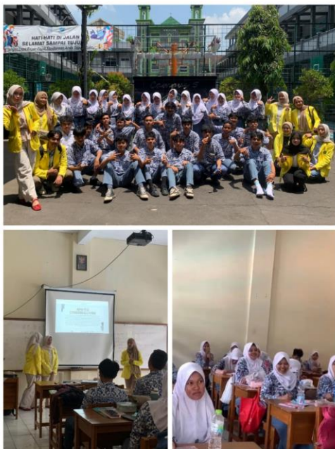
Gambar 3. Kegiatan Sosialisasi Pencegahan Cyberbullying

Evaluasi yang dilakukan setelah kegiatan sosialisasi mengenai cyberbullying telah menunjukkan pentingnya pemahaman siswa terhadap bahaya yang ditimbulkan oleh perilaku tersebut. Kegiatan ini, salah satunya bagian dari inisiatif “DigitalWise Education”, mengedepankan diskusi mendalam mengenai kasus nyata korban cyberbullying untuk mengedukasi siswa tentang dampak negatif pada kesejahteraan mental dan emosional individu. Penelitian menunjukkan bahwa perlunya memfasilitasi siswa untuk memahami berbagai bentuk cyberbullying, termasuk tindakan penyerangan berulang melalui platform digital, yang dapat menyebabkan depresi dan kecemasan, terutama di kalangan anak-anak dan remaja (Hou, 2023; , Park et al., 2021). Dengan memberikan konteks nyata melalui diskusi dan simulasi, siswa dapat lebih memahami bagaimana dampak psikologis dari perilaku tersebut dapat mengganggu keseimbangan emosional mereka dan teman-teman sebaya mereka.