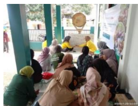
Gambar 1: Pertemuan Pertama Pelatihan Kemampuan Dasar Bahasa Inggris

peserta terlihat bersemangat dan antusias kembali. Setelah pematerian dirasa cukup selanjutnya mahasiswa menyimpulkan dan memberikan soal posttest sebanyak 10 soal untuk mengetahui perbedaan kemampuan sebelum dan sesudah diberikan nya pematerian. Mahasiswa juga memberikan beberapa selebaran kosa kata dan nama sayuran dan buah buahan untuk para peserta pelajari agar menjadi pegangan ketika ingin mengulas kembali pematerian.