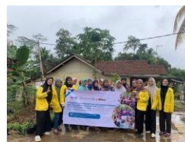
Gambar 2: Dokumentasi Setelah Pembelajaran

Hari kedua , 30 November 2023 di KWT Mandoro, karena kebetulan pada hari itu turun hujan jadi antusias para peserta menurun dari program hari pertama. Sama halnya dengan pertemuan sebelumnya. Mahasiswa memberikan soal pretest terlebih dahulu sebanyak 10 soal untuk mengetahui di tahap mana kemampuan para peserta. Setelah pematerian greetings , small talk dan closing selesai, tidak lupa mahasiswa memberikan soal posttest juga agar mahasiswa mengetahui peningkatan pengetahuan mereka.