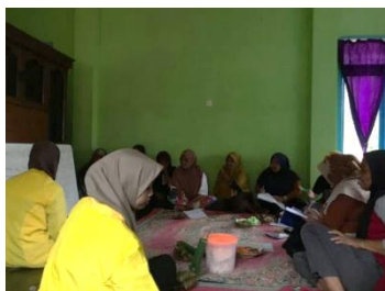
Gambar 3: Proses Pembelajaran Hari Ketiga

Setiap KWT nya mahasiswa diberikan selebaran kosa kata, nama sayuran dan buah buahan agar ketika ingin mempelajari nya bisa melihat kembali referensi dari selebaran yang mahasiswa berikan. Tak lupa mahasiswa juga selalu melakukan dokumentasi Foto bersama di setiap pelaksanaan program.